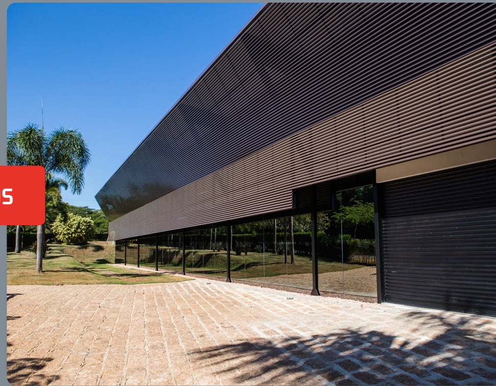
PROJETO GARAGEM INDAIATUBA EXECUÇÃO DOS PROJETOS ESTRUTURAIIS METÁLICOS E GERENCIAMENTO DA OBRA PARA AMPLIAÇÃO DE EDIFÍCIO GARAGEM.