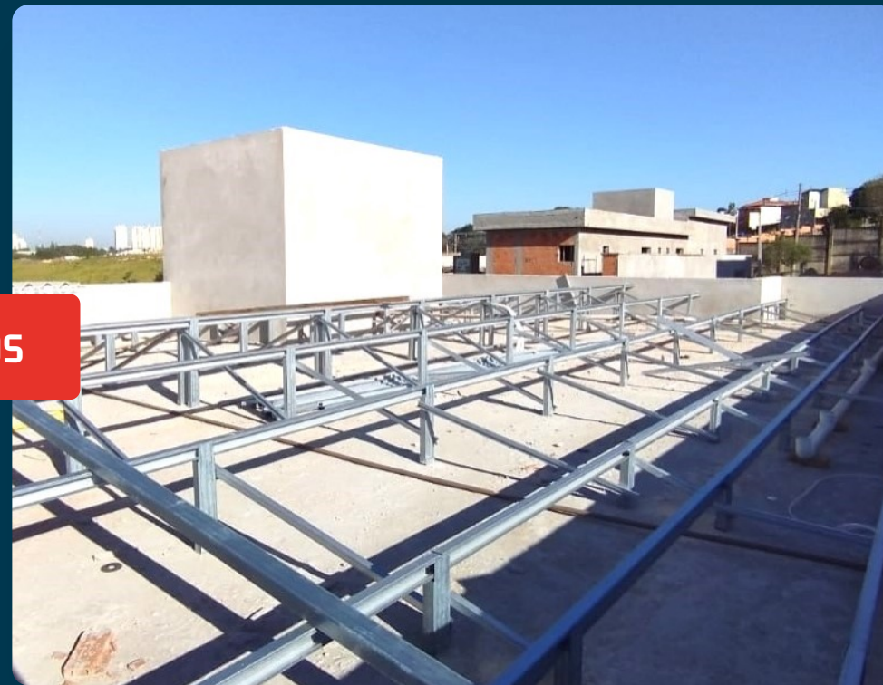
RESIDENCIAS COM PERFIL GALVANIZADO PARA TELHADOS.