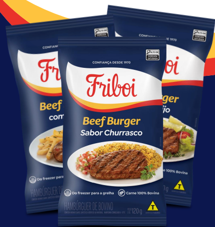
Beef Burger Friboi